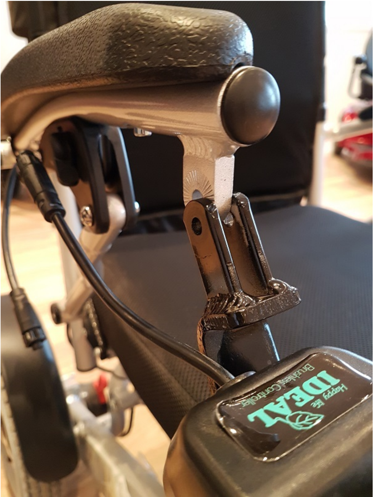
Fäst joysticken i dess fäste under armstödet.